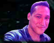
Ruber Habid Voz y Coros