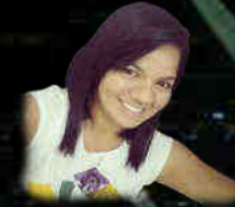
Carolina Voz y Coros